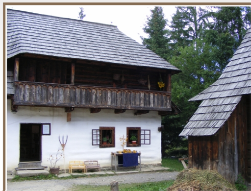
Múzeum Oravskej dediny - Zuberec Brestová

Múzeum je situované v krásnom podhorskom prostredí v podhorí Roháčov. Pôvodne na mieste dnešného múzea nestál žiaden dom. V roku 1967 sa tu začalo stavať múzeum, do ktorého sa postupne premiestňovali domy z rôznych oravských dedín. Viac ako 50 stavieb ľudovej architektúry je tu rozostavených v niekoľkých celkoch, ktoré pripomínajú jednotlivé časti Oravy. V múzeu sú umiestnené tiež rôzne technické stavby ako mlyn, olejareň a iné. Súčasťou múzea je aj drevený gotický kostol sv. Alžbety Uhorskej zo začiatku 15. storočia. V objektoch sú originálne národopisné exponáty a ukážky ľudovej remeselnej výroby.