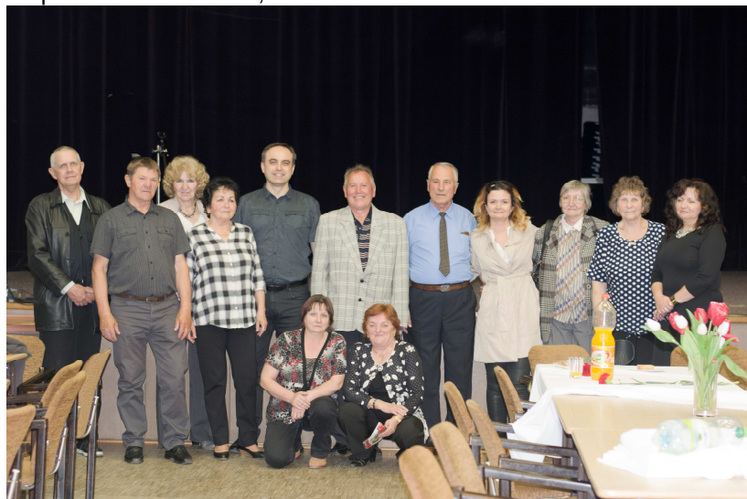
Na obr. Výbor Základnej organizácie SP v Ilave s hosťami.