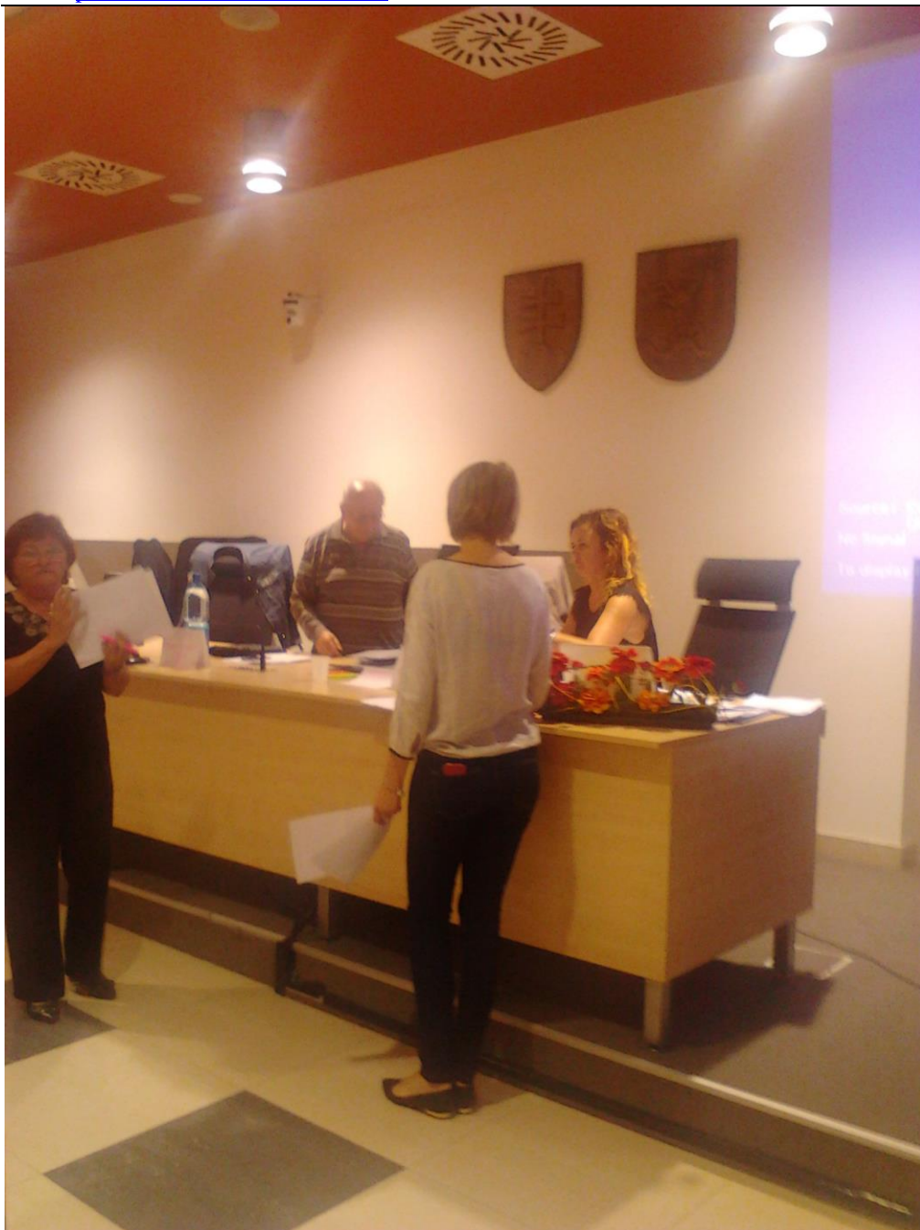
Príprava Ustanovujúceho kongresu novej „strechy“ SP v Bratislave