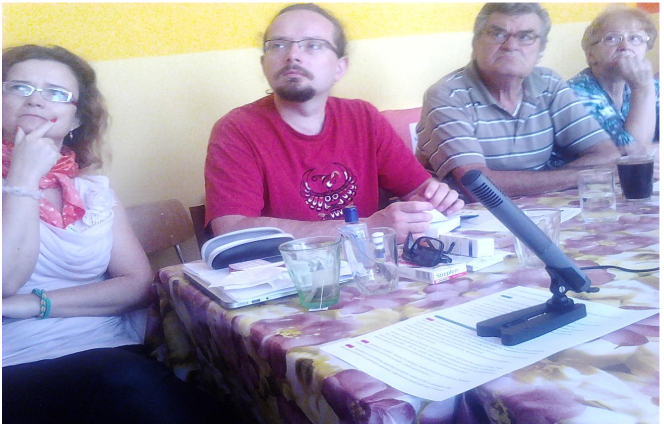
Foto zo stretnutia funkcionárov v Trnave